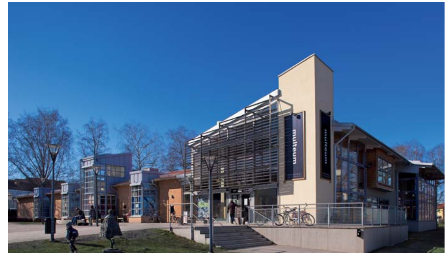
13 september 2003 invigdes Multeum. Arkitekt är Martin Rangfast.

I Strängnäsrummet har lokalhistoria en given plats. I Burspråket och