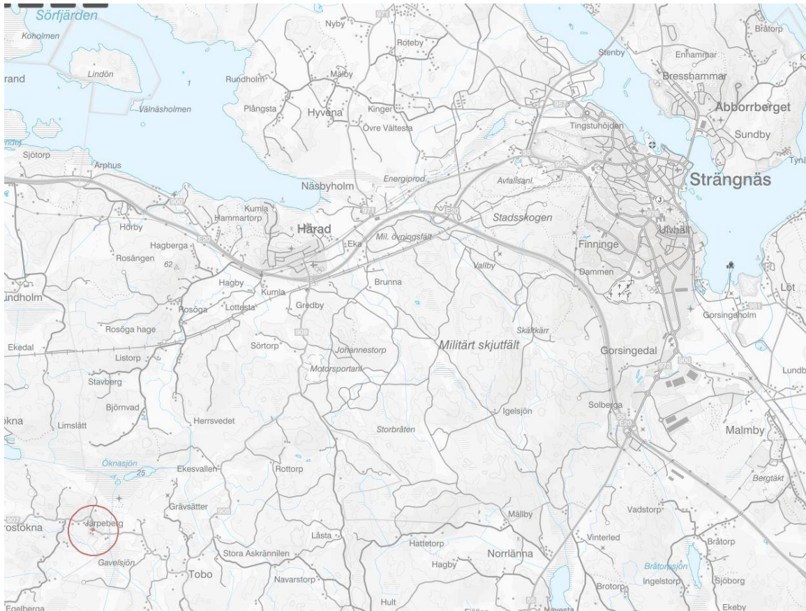
Figur 2: Planområdets ungefärliga lokalisering inringat i rött. Bild visar planområdets avstånd i relation till Strängnäs tätort.