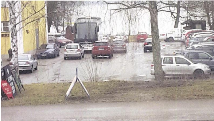
Parkeringsituation lördag 1 april