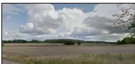
Jordbruksbygd sett från Berga

En omdaning av gamla krutbruksområdet till mer flexibel användning kan förmodligen innebära en positiv effekt på upplevelsen av området, dock krävs stor hänsyn och vördnad mot kulturhistoriska värden på platsen.