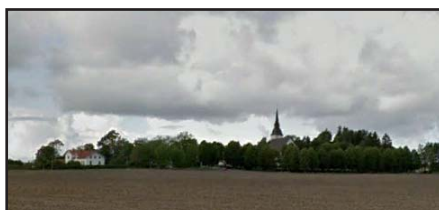
Åkers kyrka med omgivning

Stadsbilden kan ofrånkomligt komma att påverkas vid utbyggnad kring de centrala delarna av tätorten. Avsikten i förslaget är dock att ju närmare bebyggelsen sträcker sig mot bruksområdena desto mer hänsyn och anpassning krävs vad gäller utformning och volymer. Karaktärerna i de planerade områdena skiljer sig dock inte avsevärt från befintlig bebyggelse på orten.