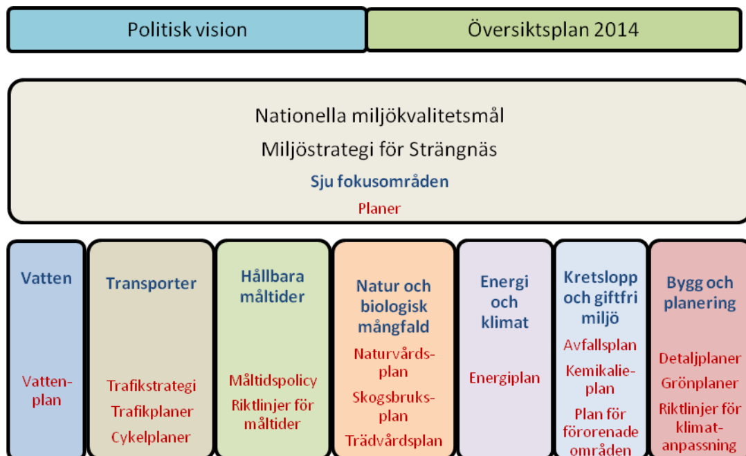
Figur 2. Strategin och planerna

Planer är styrdokument över initiativ som ska tas, ger klara besked om åtgärder som ska utföras, vem som ska vidta dem, vilka resultat som ska bli följden och hur de ska följas upp. Huvudfokus är på de åtgärder som kommunen har rådighet över och som kan följas upp.